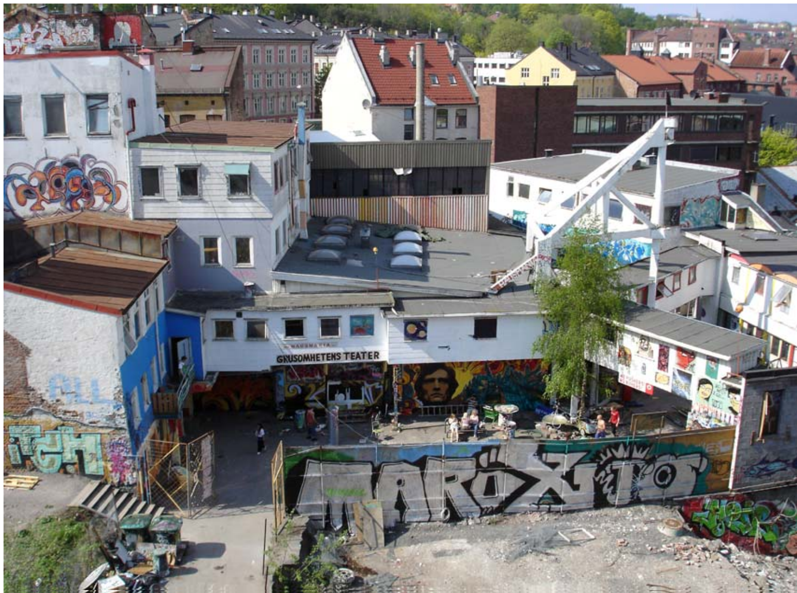
Kulturhuset Hausmania, sett fra nye Elvebakken Videregående skole. Til venstre i bildet ligger hovedbygningen (Hausmannsgate 34), midt i bildet ligger Grusomhetens teater, blåhallen og graffitiveggen og til høyre, ned mot Akerselva, ligger musikkavdelingen og brakkene. I bakgrunnen, helt til venstre, skimtes så vidt Vestbredden (Hausmannsgate 40) og Alle Kanter (Hausmannsgate 42).