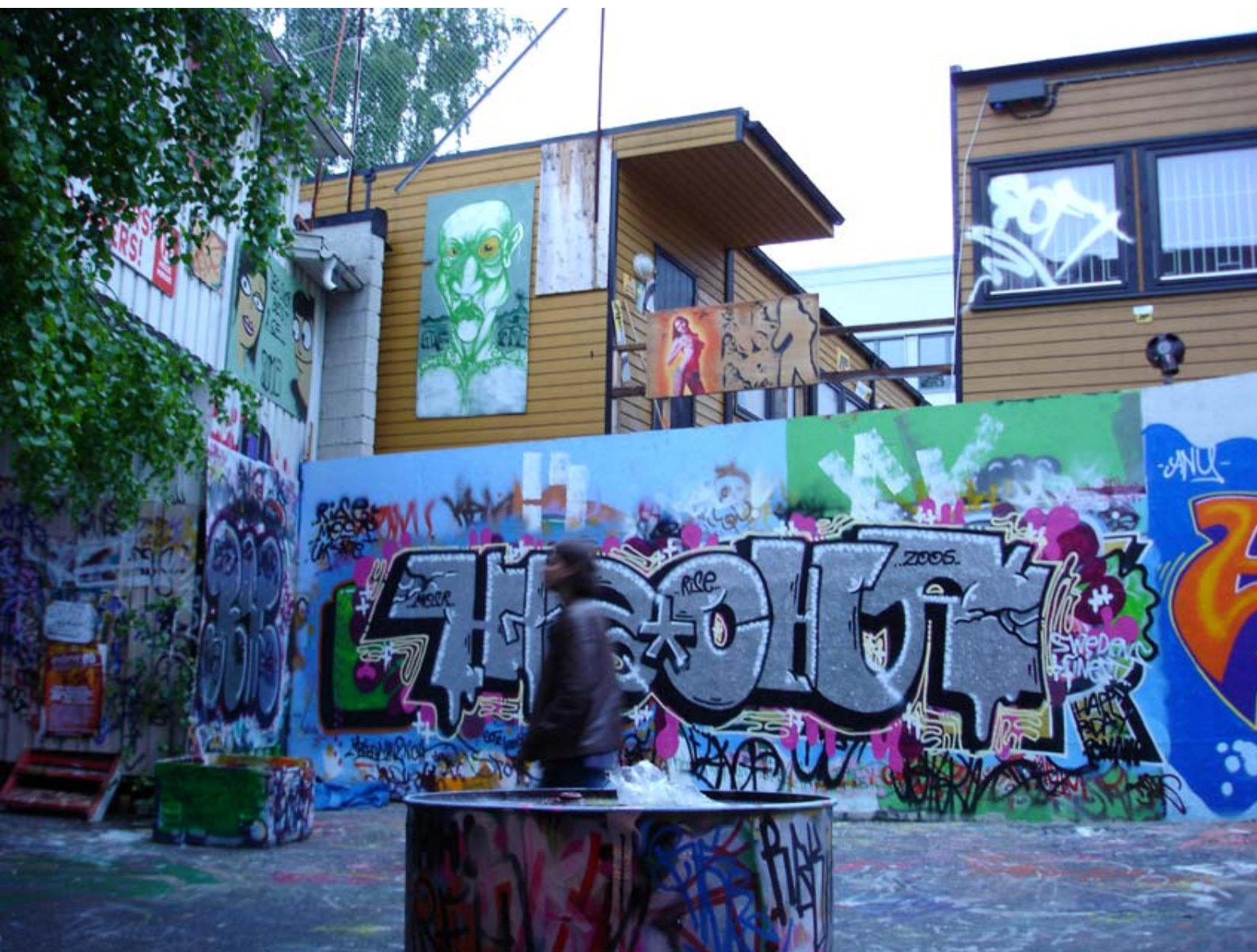
Graffiti-veggen på Kulturhuset Hausmania.