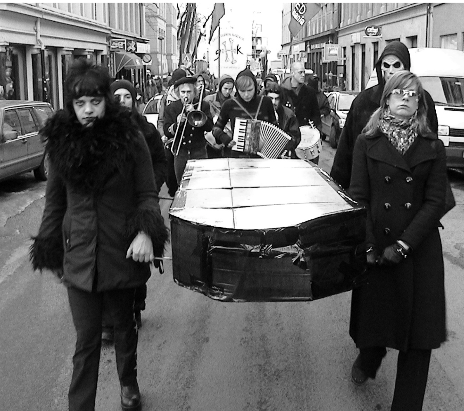
Begravelsen av det "frie kulturinitiativet", onsdag 18. februar 2004.